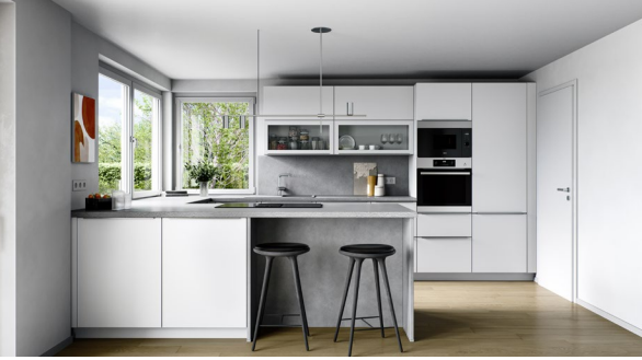
Markenküche mit Komplettausstattung